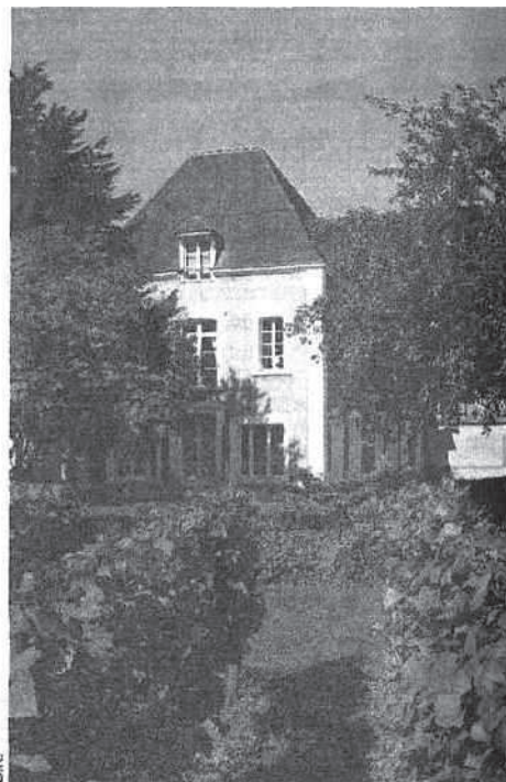
La petite maison Jacquesson, à Dizy, en Champagne.