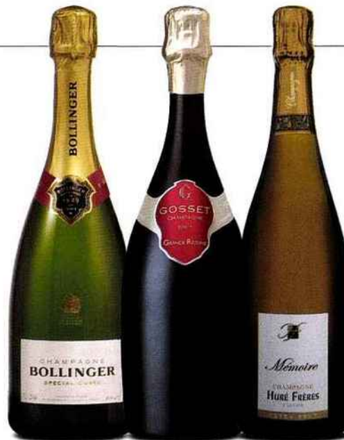
Bollinger Brut Spécial Cuvée Charnu, savoureux, complexe. 44 euros.