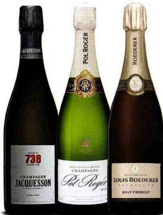
Jacquesson 738 Pur, intense, complexe. 41 euros.