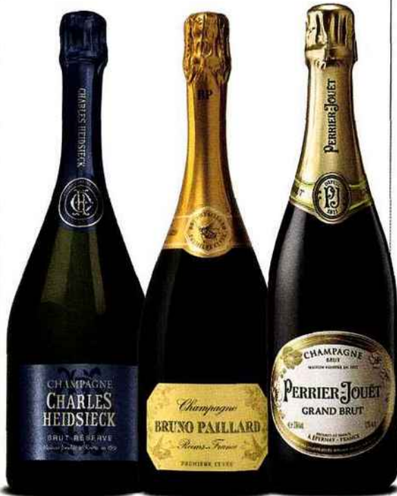
Charles Heidsieck Brut Réserve Tendre, gourmand, fin. 40 euros.