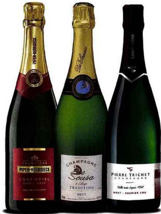
Piper Heidsieck Essentiel Frais, pulpeux, consensuel. 35 euros.