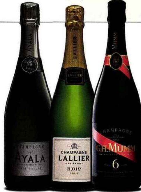
Ayala brut nature Citronné, vif, limpide. 33 euros.