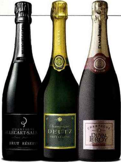
Bilcart Salmon Brut Réserve Aérien, fruité, raffiné. 38 euros.